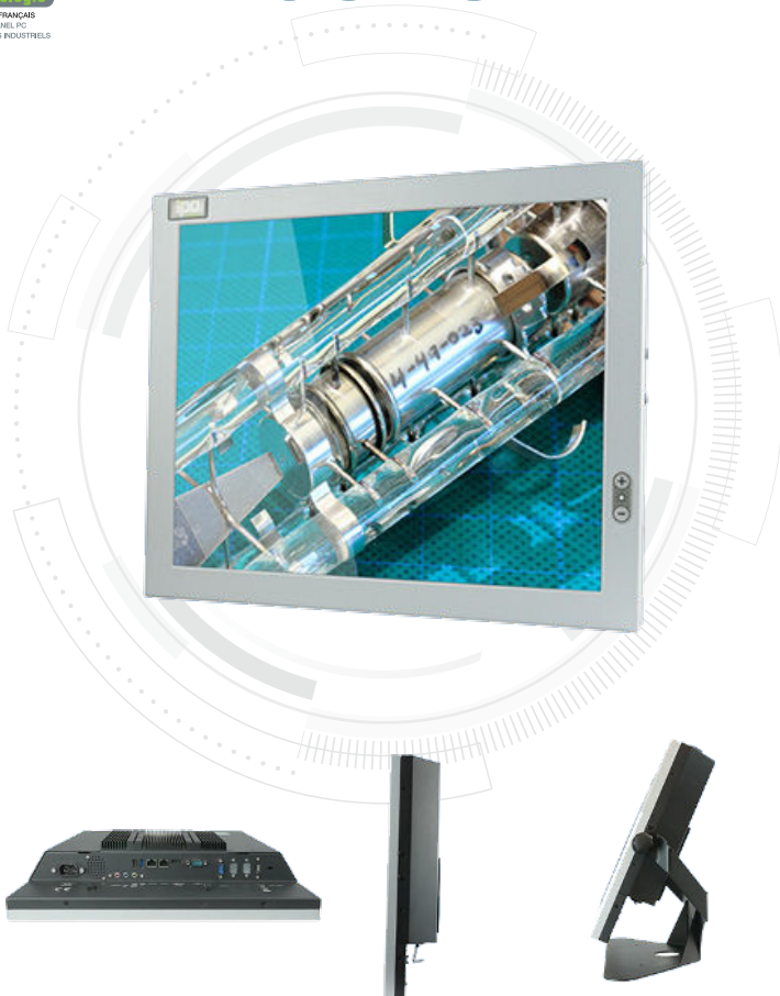
VITUS avec support PIED