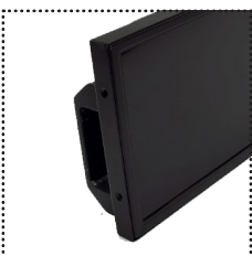
Poignée de Transport