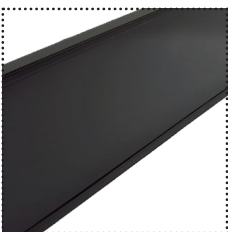
Châssis Métal Bords fin