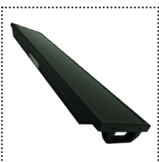
Ecran Panoramique Faible encombrement